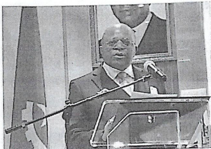
حاجب من حفل افتتاح سفارة أنفولا بالرياض أمس